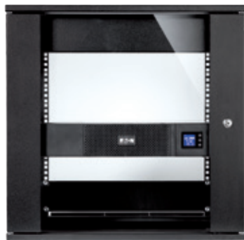
Geringe Tiefe für einfache Integration in kleinen Gehäusen