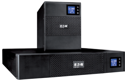
Die 5SC ist in praktischen kompakten Formfaktoren verfügbar